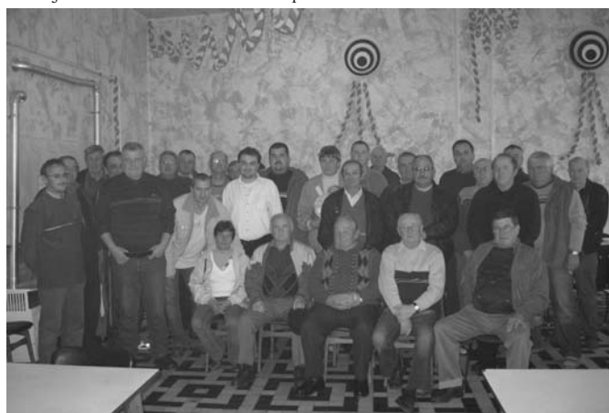
Az idei községi ulti bajnokságon 30 zslugás vett részt.