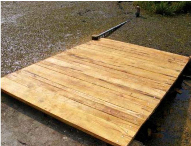
A fürdő stégje is elkészült