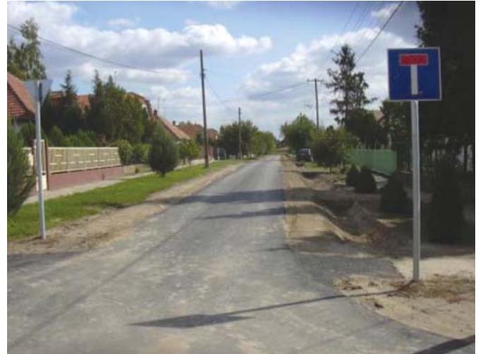
Elkészült az Arany János utca útburkolata