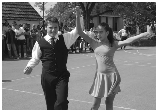
A nemzetközi kézilabdatorna megnyitóját rövid táncbemutató színesítette.

A szántói kézilabda együttes 2007. augusztus 25.-én Horvátországban, Petrijevci községben vendégszerepelt. A barátságos találkozón a házigazdák bizonyultak jobbnak, a női mérkőzésen 25-21-es, a férfi találkozón 32-27-es hazai győzelem született. Először tavaly találkozott a két együttes, a jövőben évente egy-egy alkalommal hasonló találkozókat szeretnének szervezni Petrijevciben és Hercegszántón.