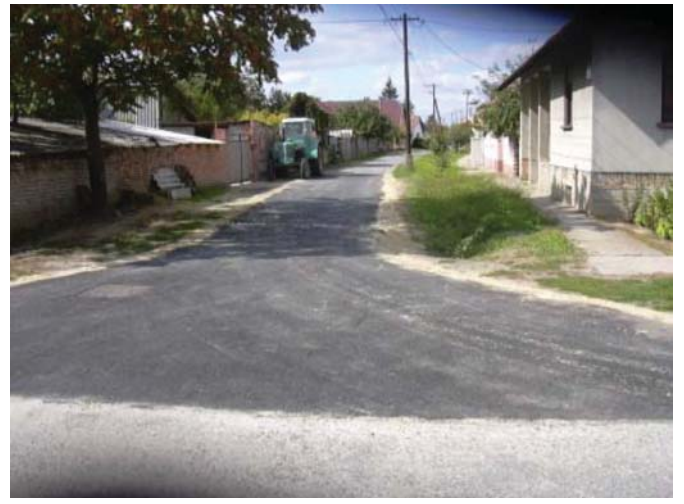
Vörös Hadsereg utca záró szakasza