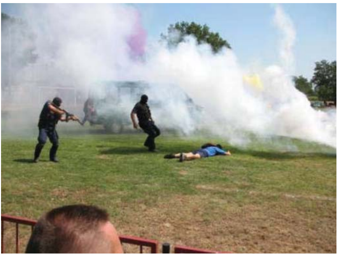
Kommandós bemutató a falunapon