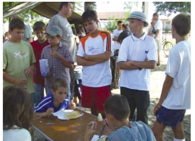
Falunapi részlet A gyermekek részére lepényevő versenyt is szerveztek