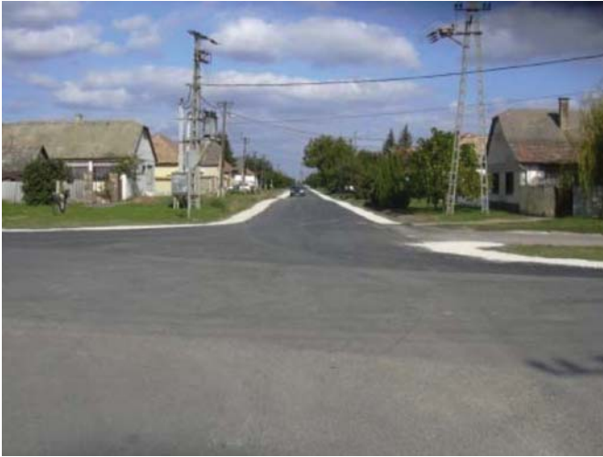
Kossuth Lajos utca - felújított Papp tanyai szakasz